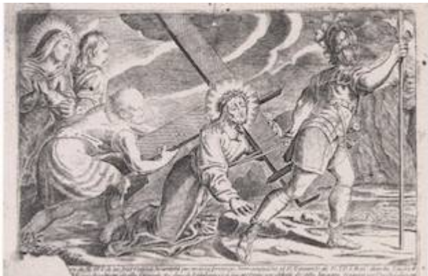
Jesús de las Tres Caídas (grabado s. XVIII)