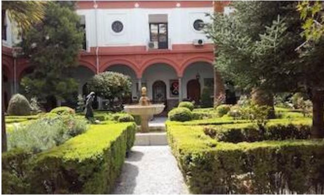
Convento San Francisco Casa Grande.