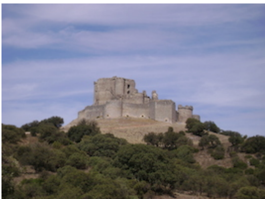
Castillo de Almenara