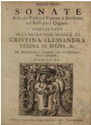
Print of Sonatas op. 1 by Corelli from 1681