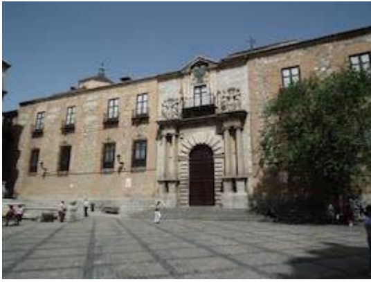
Front of the archbishops palace