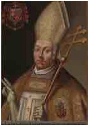
Portrait of cardinal Portocarrero at the chapter hall of Toledo Cathedral