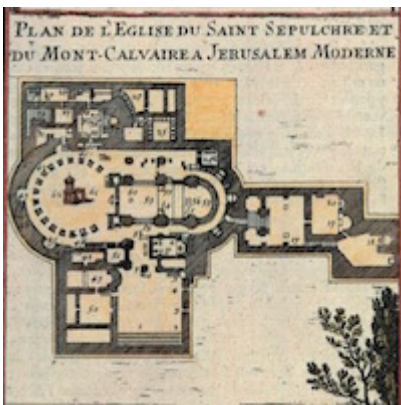
Plan of the church of the Holy Sepulcher . Alain Manesson Mallet (1683)