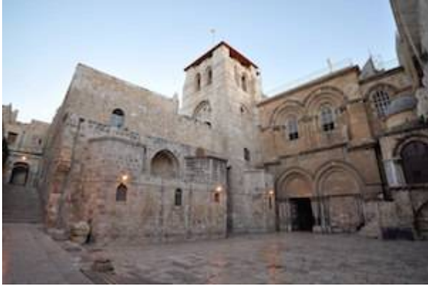
Church of the Holy Sepulchre