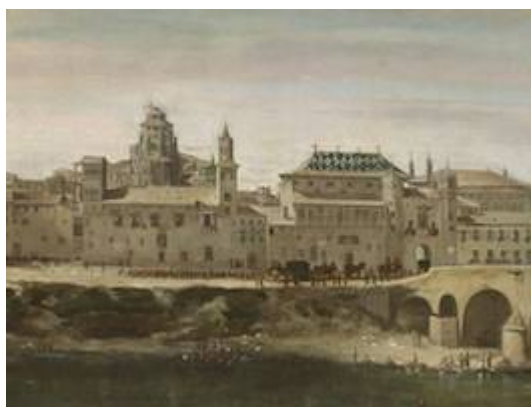
La Seo (Zaragoza cathedral)