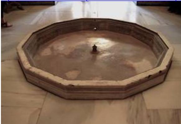
The sound of the Abencerrajes fountain. Iesalbayzin's recording

https://www.historicalsoundscapes.com/recursos/1/5/alhambra-patioleonestomaxy-iesalbayzin-ivoox26272660.mp3