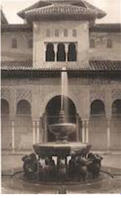
Leones fountain before 1966