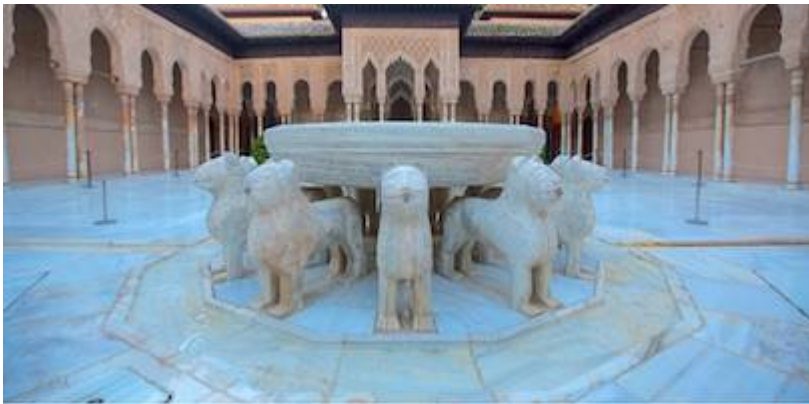
The sound of the Leones fountain. Iesalbayzin's recording

https://www.historicalsoundscapes.com/recursos/1/5/alhambra-patioleonestomaxy-iesalbayzin-ivoox26272660.mp3