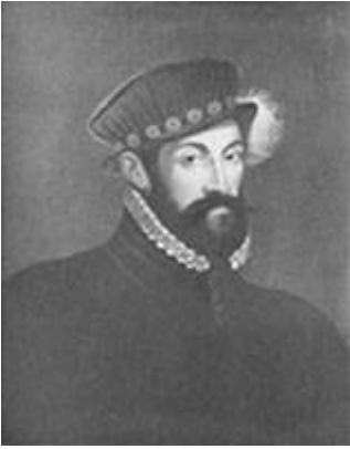
Juan de Borja