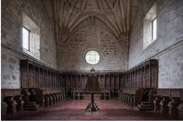
Choir of the Jeronymite monastery of Yuste