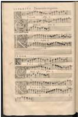
"Kyrie". Missa Dormendo un giorno . Francisco Guerrero. Liber primus missarum (París, 1566), fol. XCVv