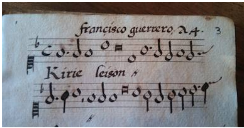
Mass L'homme armé a 4. Francisco Guerrero. E: Asa 2