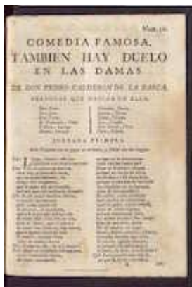
También hay duelo en las damas. Pedro Calderón de la Barca