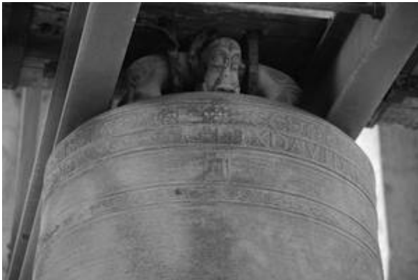
City Hall Clock Bell (1699)