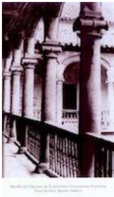
convent of la Concepción Jerónima