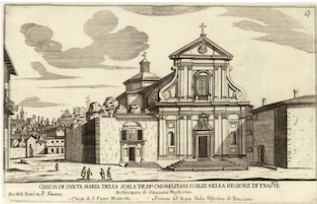
church of Santa Maria della Scala