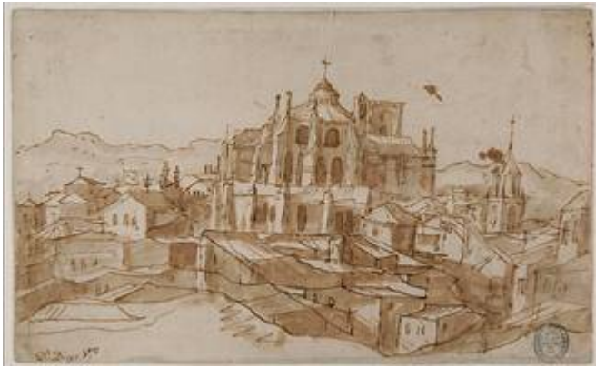
View of the Cathedral with the belfry of the convent of St. Augustine on the right side. Anonymous (17 th.)