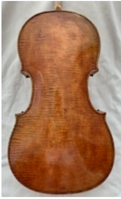
Back plate. Cello (particular collection).

https://www.youtube.com/embed/OFXw3xeInog?iv_load_policy=3&fs=1&origin=https://www.historicalsoundscapes.com