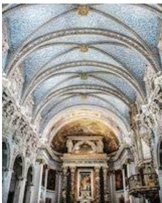
Church of San Esteban