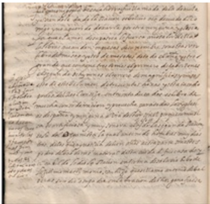
Historia civitatense , tomo II, fol. 18v