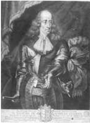
Gaspar de Haro y Guzmán, VII marqués del Carpio y de Eliche. Arnold van Westerhout