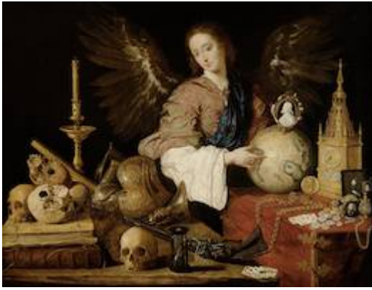
Alegoría de la Vanidad. Antonio de Pereda y Salgado (1632-1636)