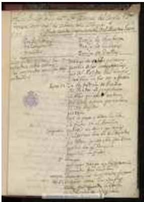
Sung and danced sainete. Manuel de León Marchante (1671)