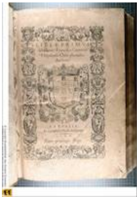
Title page. Liber primus missarum (Paris, 1566). [CH-E Mw1]