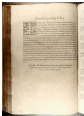
Printing privilege. Liber primus missarum (Paris, 1566). [CH-E Mw1]