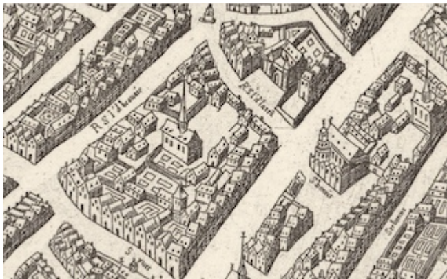
Saint-Jean-de-Latran street (1609)