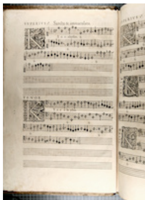
Liber primus missarum (Paris, 1566), fol. 2v. [CH-E Mw1]