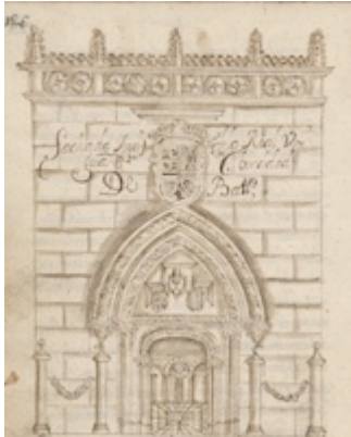
University (old façade)