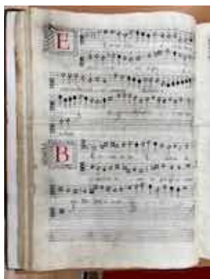
Beatus es et bene tibi erit. [E-GUA 7], fol. 40v

https://embed.spotify.com/?uri=https://open.spotify.com/track/7bFRIMalJ1rg2s07GanQbF?si=kXAR_hRMRYuP_rahn7m9lg