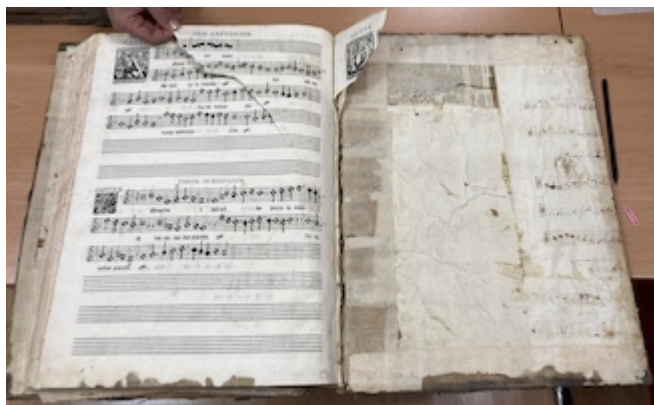
Missarum liber secundus (1582), fols. 119v-120r