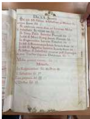
Index. Libro de coro con obras en canto llano y polifonía [E-GUA 7]