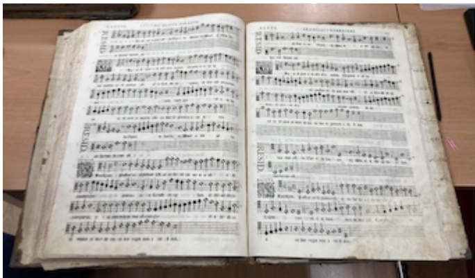
Missarum liber secundus (1582), fols. 112v-113r