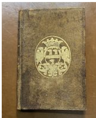
Binding. Juan Martínez. Arte de canto llano . (Alcalá: Diego de Angulo, 1565)