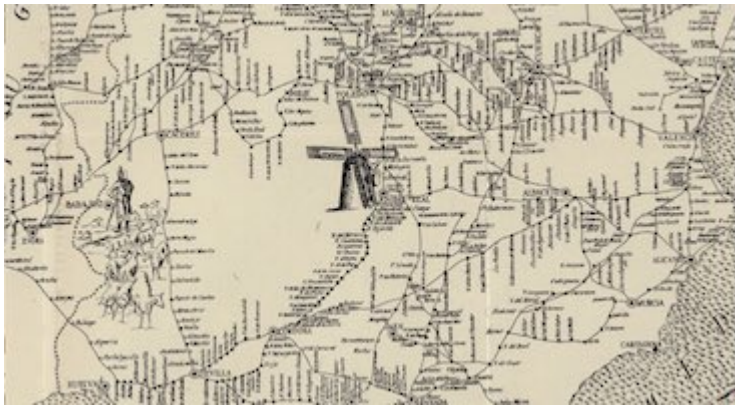
Route from Seville to Madrid. Reportorio [sic] de todos los caminos de España . Juan Villuga (1546)