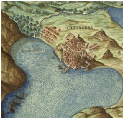
Port of Cartagena. La descripción de España y de las costas y puertos de sus reinos , fol. 71r. Pedro Teixeira (1634)