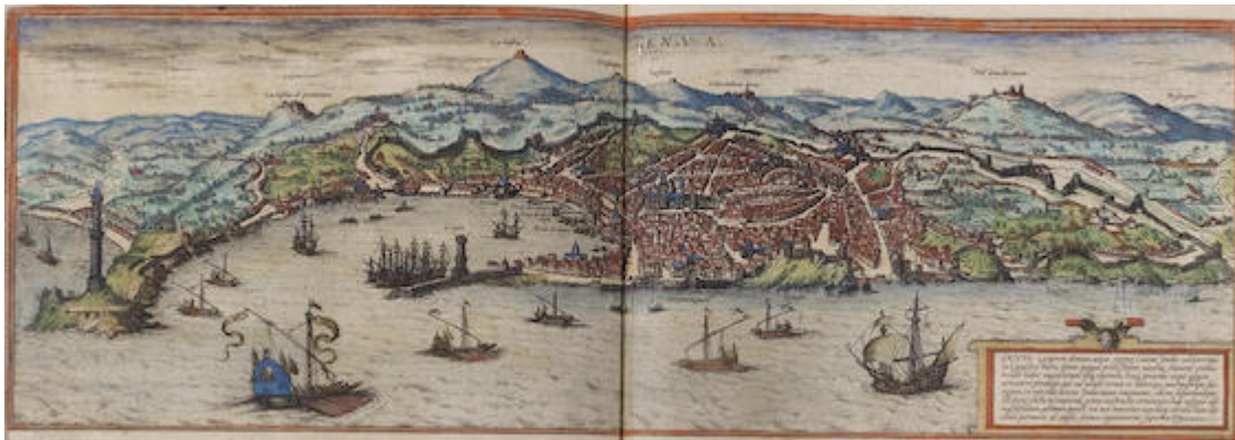
Genoa. Génova. Beschreibung vnd Contrafactur der vornembster Stät der Welt , vol. 1, fol. 45v (1582). Georg Braun, Franz Hogenberg