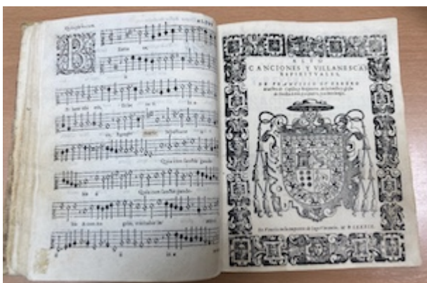
Cover page. Canciones y villanescas (1589). Francisco Guerrero