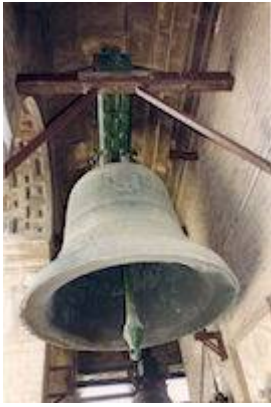
Santa María's bell (1588). Catedral de Sevilla. Juan de (Valdecilla) Balabarca.