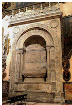
Tomb of Francisco Guerrero at the foot of the funerary monument of Luis Salcedo y Azcona

https://www.historicalsoundscapes.com/evento/1578/sevilla .