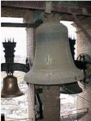
Santa Catalina's bell (1599). Catedral de Sevilla