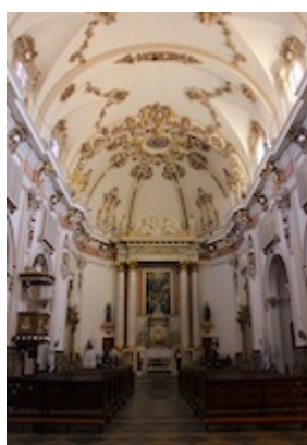
Convento de la Santísima Trinidad de Valencia