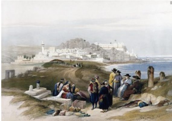
Jaffa. David Roberts (1839)