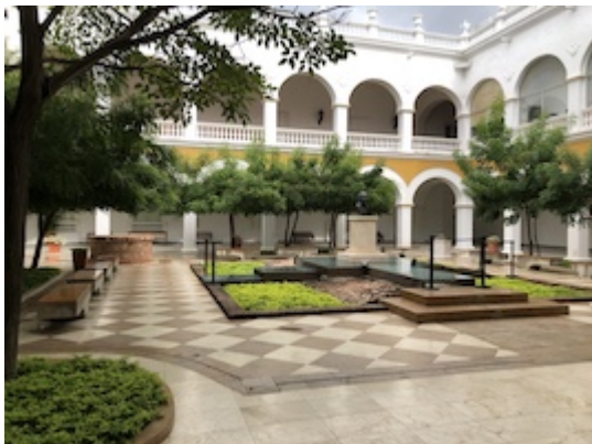
Cloister of the convent of Nuestra Señora de la Merced in Cartagena de Indias