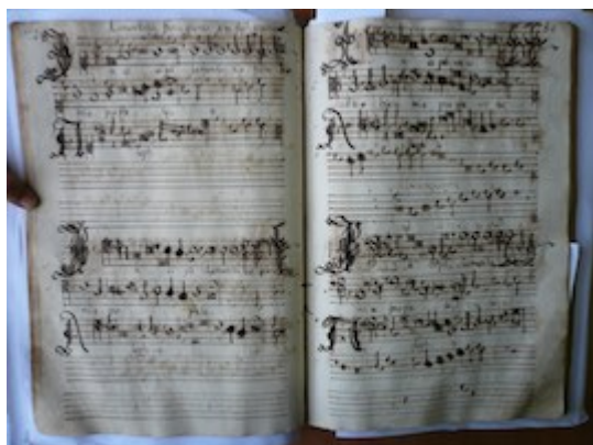
Incipit lamentatio Hieremias prophet. Francisco Guerrero [GCA-Gc Ms. 4, fols. 79v-80r]