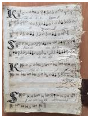
Sicut cervus [Francisco Guerrero] [GCA-Gc Ms. 3, fol. 76v]