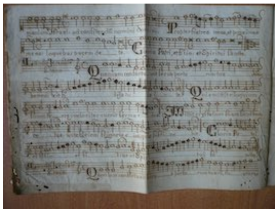
Lauda Jerusalem. 8º Tono. Tiple. [Francisco Guerrero] [GCA-Gc Papeles de Música 451]