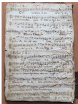
Contraducem superbiae [Francisco Guerrero] [GCA-Gc Ms. 3, fol. 5v]