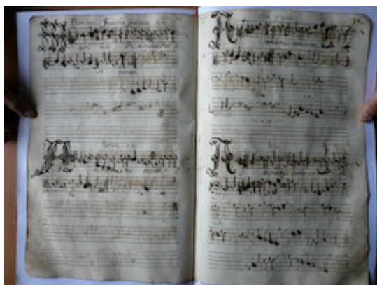
Anima mea Dominum. Primi toni. Francisci Guerrero [GCA-Gc Ms. 2, fols. 14v-20r]