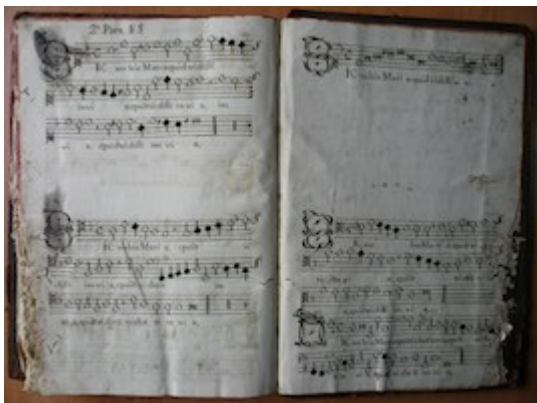
Dic nobis Maria [Francisco] Guerrero [GCA-Gc Ms. 1, fols. 191v-192r]