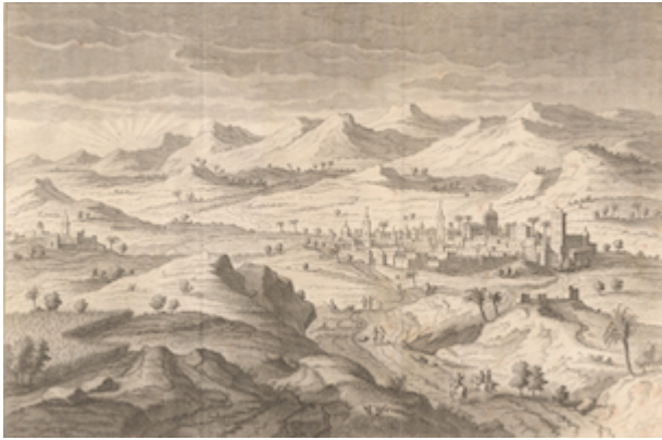
Vue de la ville de Rama située a l'occident de Jerusalem, entre Lydda et Joppé. Antoine Augustin Calmet (1730)