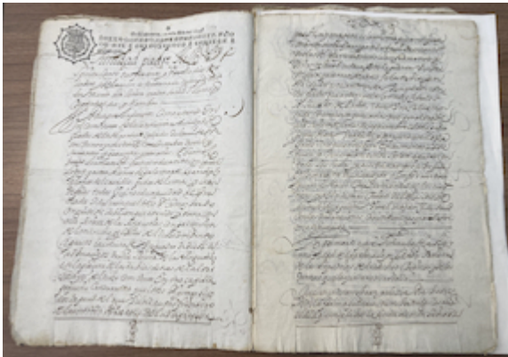
Constitutions of the confraternity of Our Lady of Anguish at the Tablas square (1643)