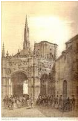
Plaza de la Trinidad (on the right, door of the convent of la Santísima Trinidad, 1862)