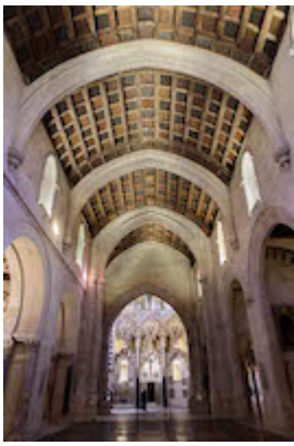
Location of the old Gothic choir