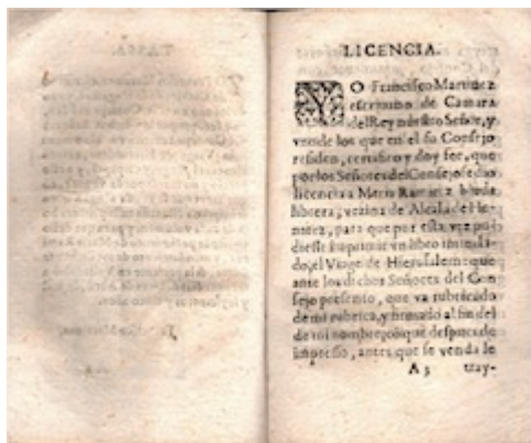
Licencia. El viage de Hierusalem . Francisco Guerrero (Alcalá de Henares: Juan Gracián, 1605)