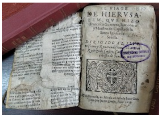
Front cover. El viage de Hierusalem . Francisco Guerrero (Alcalá de Henares: Juan Gracián, 1609)