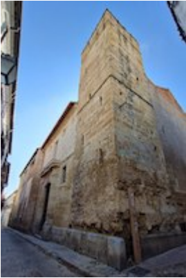
convent of Santa Catalina, Santa Clara and Santa Isabel

This article is available under a license Creative Commons Reconocimiento-NoComercial 4.0 Internacional (CC BY-NC 4.0) .