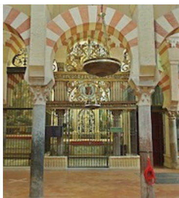
Former location of Santa María Magdalena Chapel