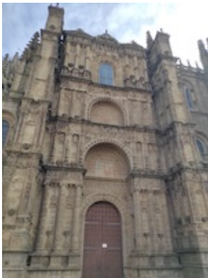
Cathedral of Plasencia.