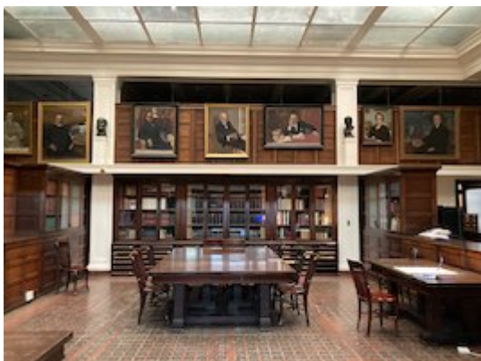
Library of the Hispanic Society of America (New York).