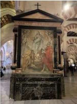
Altarpiece of San Felipe y Santiago. Antonio del Castillo (c. 1660)