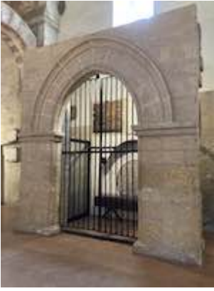
Door of the chapel of San Felipe and Santiago (museum of San Clemente).