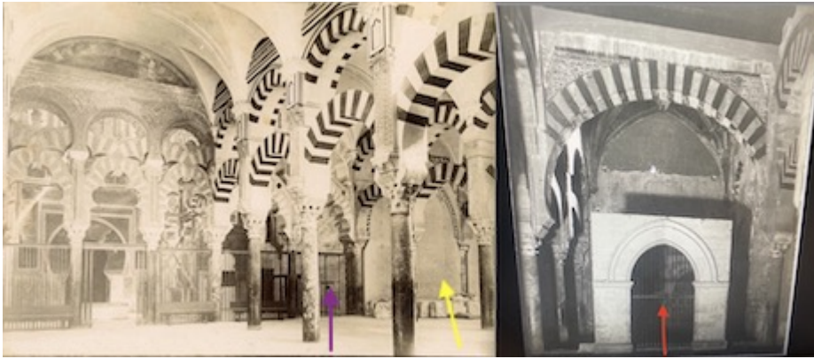
Door of the chapel of San Felipe and Santiago.