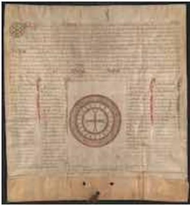
Privilege of Alfonso X to the University of the clergy of Cordova (1279)