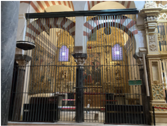
Chapel of La Expectación de Nuestra Señora (1). Cathedral of Cordova.

Referencing: Ruiz Jiménez, Juan. "Foundation and endowments in the chapel of La Encarnación or Expectación de Nuestra Señora in the Cathedral of Cordova (1364)", Historical soundscapes , 2025. e-ISSN: 2603-686X. https://www.historicalsoundscapes.com/evento/1721/cordoba .