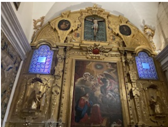
Chapel of La Expectación de Nuestra Señora (2). Cathedral of Cordova.