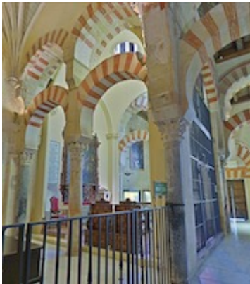
Chapel of San Esteban and San Bartolomé (2)