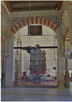
Chapel of San Esteban and San Bartolomé (1)