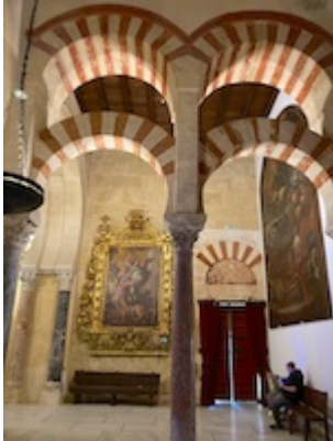
Chapel of San Miguel. Cathedral of Cordoba.