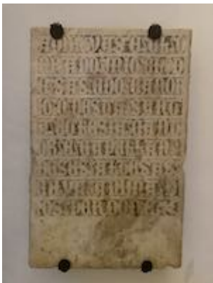
Tombstone of Miguel de Salcedo. Chapel of Villaviciosa. Cathedral of Cordoba (1502).