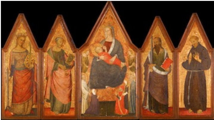
Polyptych of the Virgin of Milk. Anonymous (1368–1390)