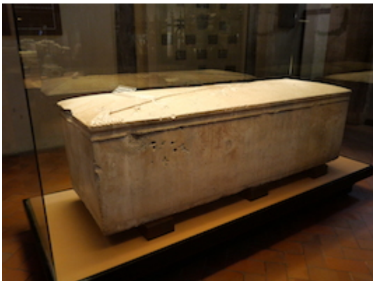
Sarcophagus of Alfonso Fernández de Montemayor (1390).