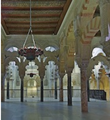
Chapel of Saint Peter (former Tabernacle)