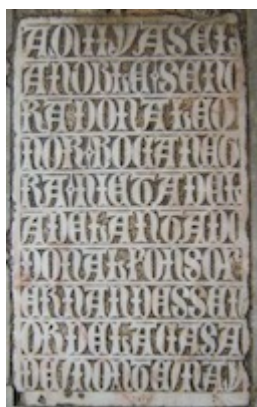
Tombstone of Leonor Bocanegra (1448)