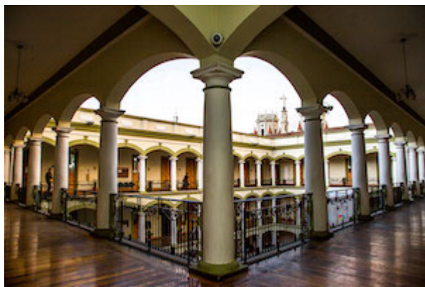
Former convent of Nuestra Señora de la Concepción (currently the Nariño Government building)