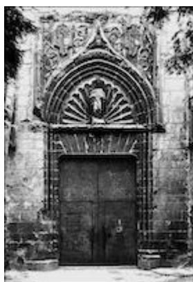
Convent of Jerusalén in Valencia