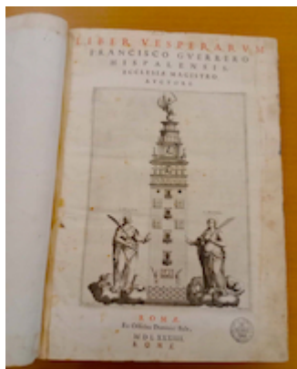
Title page. Liber vesperarum (Roma 1584). Francisco Guerrero.

https://embed.spotify.com/?uri=https://open.spotify.com/intl-es/track/58YiDOUc29rvH4GnZnbHEw?si=27eb5ef109df471b