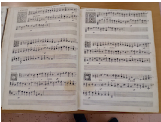
Missarum liber secundus (Roma 1582), fols. 1v-2r. Francisco Guerrero.