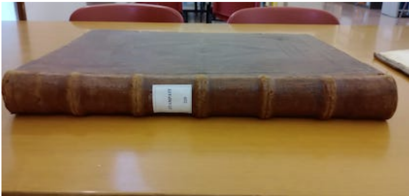
bookbinding. Liber vesperarum (Roma 1584). Francisco Guerrero.