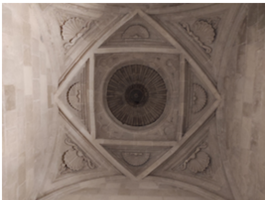
Cathedral of Murcia. Archive reading room.

Published: 09 Jan 2026 Referencing: de Vicente Delgado, Alfonso. "Documents about Tomás Luis de Victoria in the cathedral of Murcia (1592-1612)", Historical soundscapes , 2026. e-ISSN: 2603-686X. https://www.historicalsoundscapes.com/evento/1749/murcia .