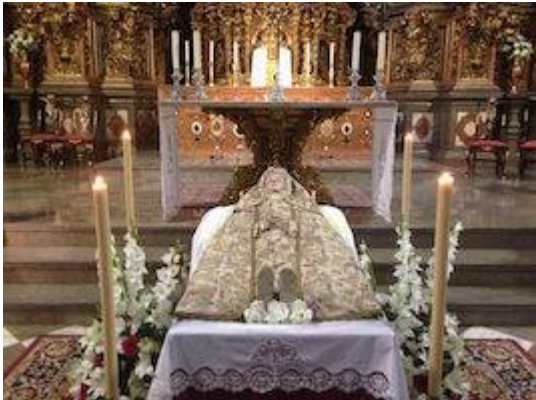
Iglesia de San Ildefonso (15 de agosto)